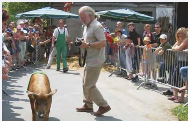
Philippe Schmittler immortalise ces moments mémorables.