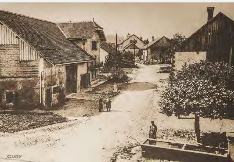
Cugy en 1920. Photo d'archive.