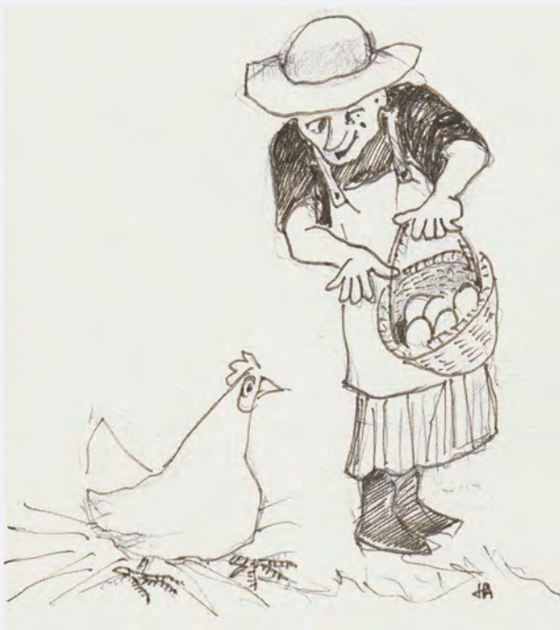
Dessin : † Heinz Altenhoefer.

En 1963, il y avait 199 vaches à Cugy. Dix ans plus tard, il n'en reste que 73 (numéro 2 des Reflets de Cugy ).