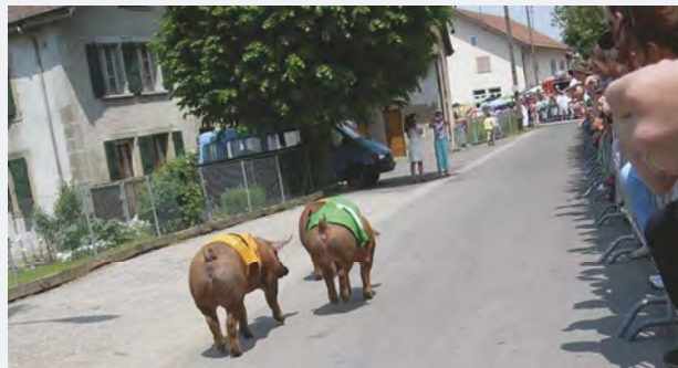
La course aux cochons de la Fête au village de 2005, un grand moment !