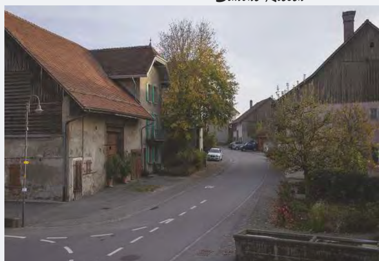
Cugy en 2022.