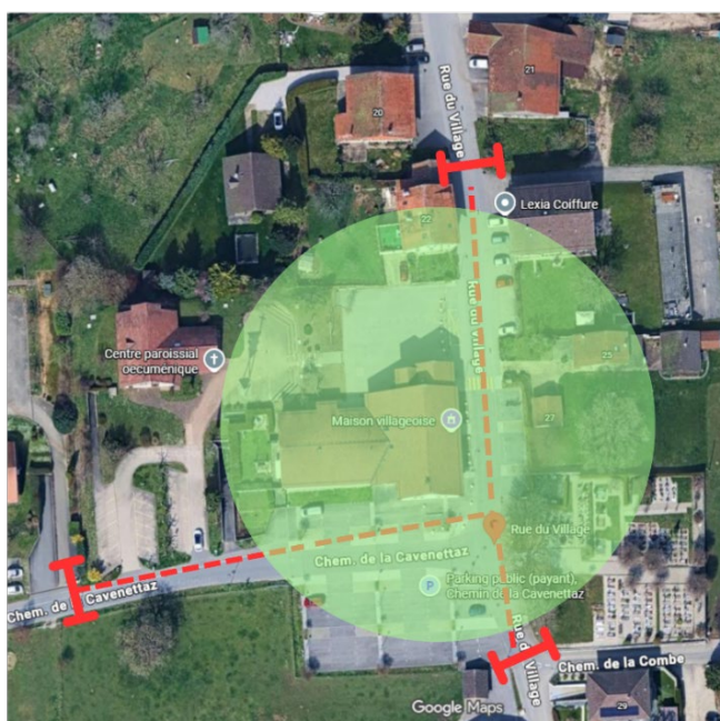
● Place de Fête --- Routes inaccessibles T Fermetures routes

Plan de fermeture des routes et place de fête ci-après.