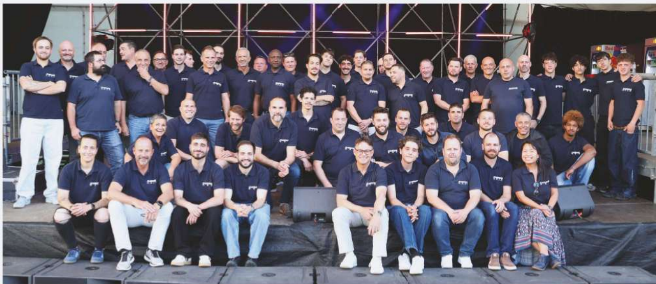
Echo du Gros-de-Vaud

Si cette entreprise est installée au Mont-sur-Lausanne, ses liens avec Cugy sont étroits par sa participation à la vie du village ; ses membres s'investissent tant dans la vie sociale que politique. Elle célèbre en 2026 son jubilé. Pour marquer ces cinquante ans, une grande fête réunissait le 21 mai amis, clients, fournisseurs et ils ont été très nombreux à se retrouver sur le site du Châtaignier.