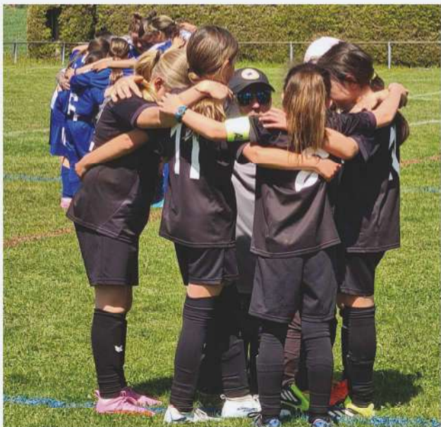
Mouvement du Centre

Le Mouvement du Centre, groupement de football junior des communes de Bottens, Cugy, Froideville, Poliez-Pittet et Villars-Tiercelin, recherche des talents féminins pour étoffer ses équipes FF11 et FF14.