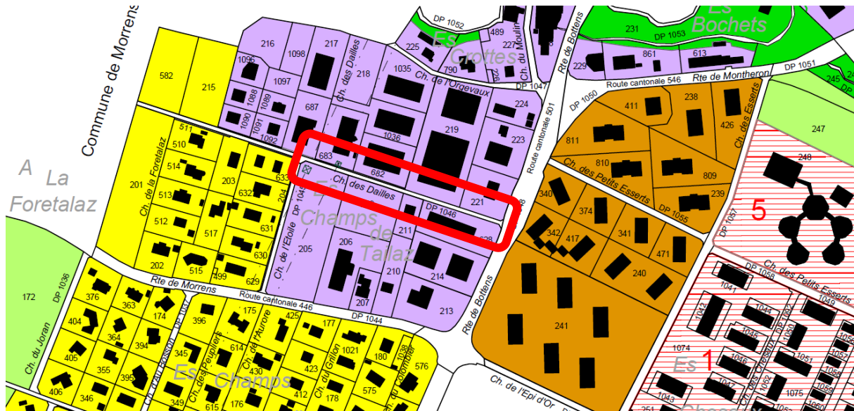
Figure 1 : Périmètre d'intervention

Le concept de réaménagement retenu, dont le plan général est présenté en annexe, prévoit une circulation bidirectionnelle, avec l'implantation d'un trottoir du côté sud. D'une largeur de 1.80 mètre, le trottoir permet une déambulation aisée des piétons, y compris pour les personnes à mobilité réduite (personnes en chaise roulante, mais aussi circulant avec un déambulateur ou avec une poussette par exemple). Le gabarit général de la chaussée est de 5.00 mètres de manière à offrir un espace suffisant pour le croisement à faible vitesse d'un poids lourd et d'une voiture légère. La portion de la chaussée la plus à l'est est légèrement plus généreuse (5.20 mètres de large) de manière à faciliter les manœuvres de croisement à proximité du débouché sur la route cantonale. Afin de ralentir les vitesses de circulation sur cet axe limité à 30 km/h, un croisement à vue, avec une largeur de chaussée de 3.60 mètres, est mis en place au niveau du bâtiment sis au n°3 du chemin des Dailles. L'extrémité est de la rue est quant à elle équipée d'un trottoir traversant, assurant un déclassement du chemin des Dailles par rapport à la route cantonale et assurant une priorité aux piétons à proximité directe de l'arrêt de bus Cugy-Moulin.