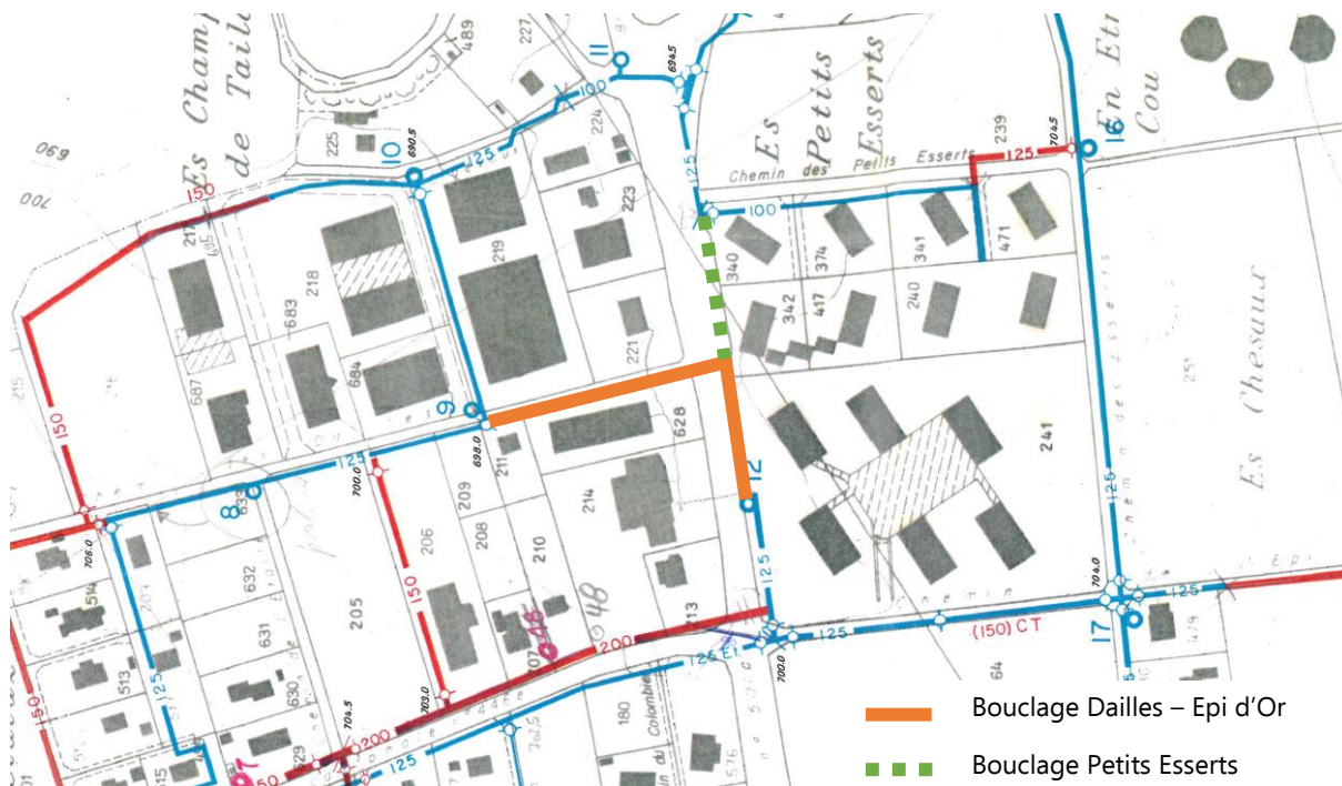
Figure 2 : Principe de bouclage du réseau d'eau potable dans le secteur Dailles – Epi d'Or

Le bouclage du secteur Petits-Esserts finalisera le renforcement du réseau d'eau potable du secteur nord de Cugy. Il interviendra dans le cadre du chantier du giratoire et du réaménagement de la route cantonale RC 501. A noter que l'ensemble des travaux se feront en coordination avec le Service de l'eau de la Ville de Lausanne qui interviendra sur son propre réseau tant au niveau de la route cantonale que du chemin des Dailles, avec la pose d'une nouvelle conduite.