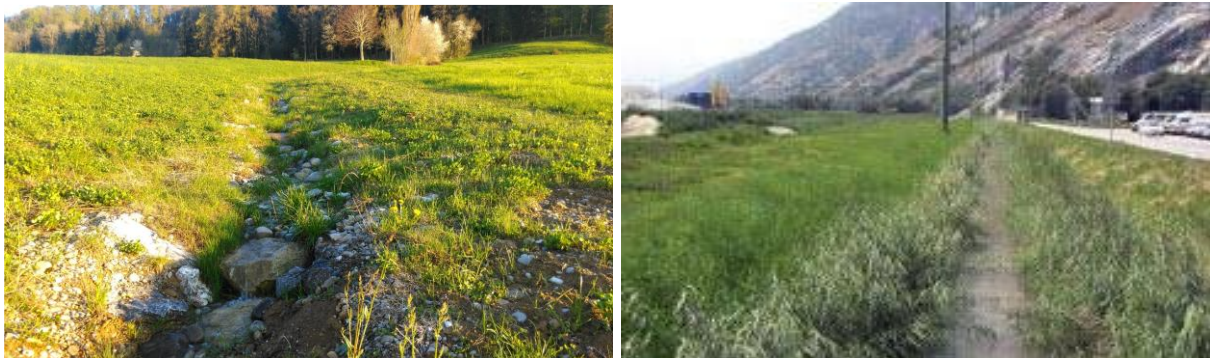
Figure 4 : exemples d'un aménagement comparable à celui projeté.

Les thèmes suivants devront être approfondis dans le cadre d'un projet d'ouvrage (liste non exhaustive) :