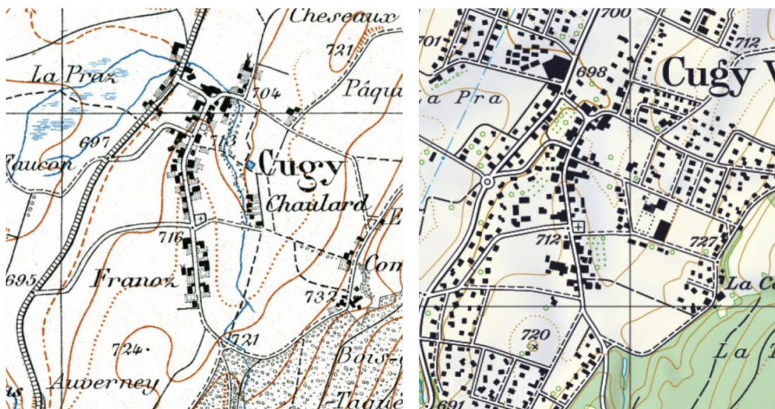
Figure 1. Cartes nationales en 1920 et 2019. En 1920, le ruisseau est bien visible sur toute sa longueur.

Dans ce contexte, la Municipalité de Cugy souhaite remettre à ciel ouvert le ruisseau de « Derrey le Motty », mis sous tuyau dans les années 1920. Ce ruisseau se situe à l'est du village et longe celui-ci, en dehors de la zone bâtie. Une remise à ciel ouvert du ruisseau est envisagée sur la portion se situant entre la forêt (angle chemin de la Lisière/chemin des Roches) et la route de la Bérallaz.