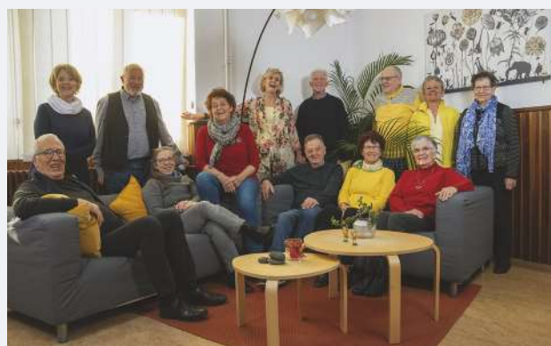
La fête de l'Envol de Talents Solidaires.