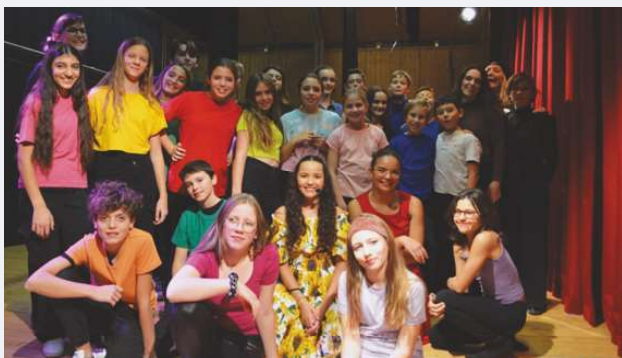
Les 8 et 9 décembre derniers, 25 élèves de l'Etablissement de Cugy et environs sont montés sur les planches pour présenter au public leur spectacle de comédie musicale.