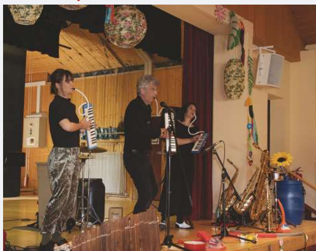
Repas des aînés le 27 avril.