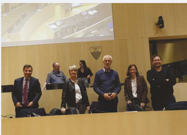
L'Exécutif et le Législatif tenaient leur séance du Conseil communal dans la salle du Grand Conseil vaudois le 11 mai.