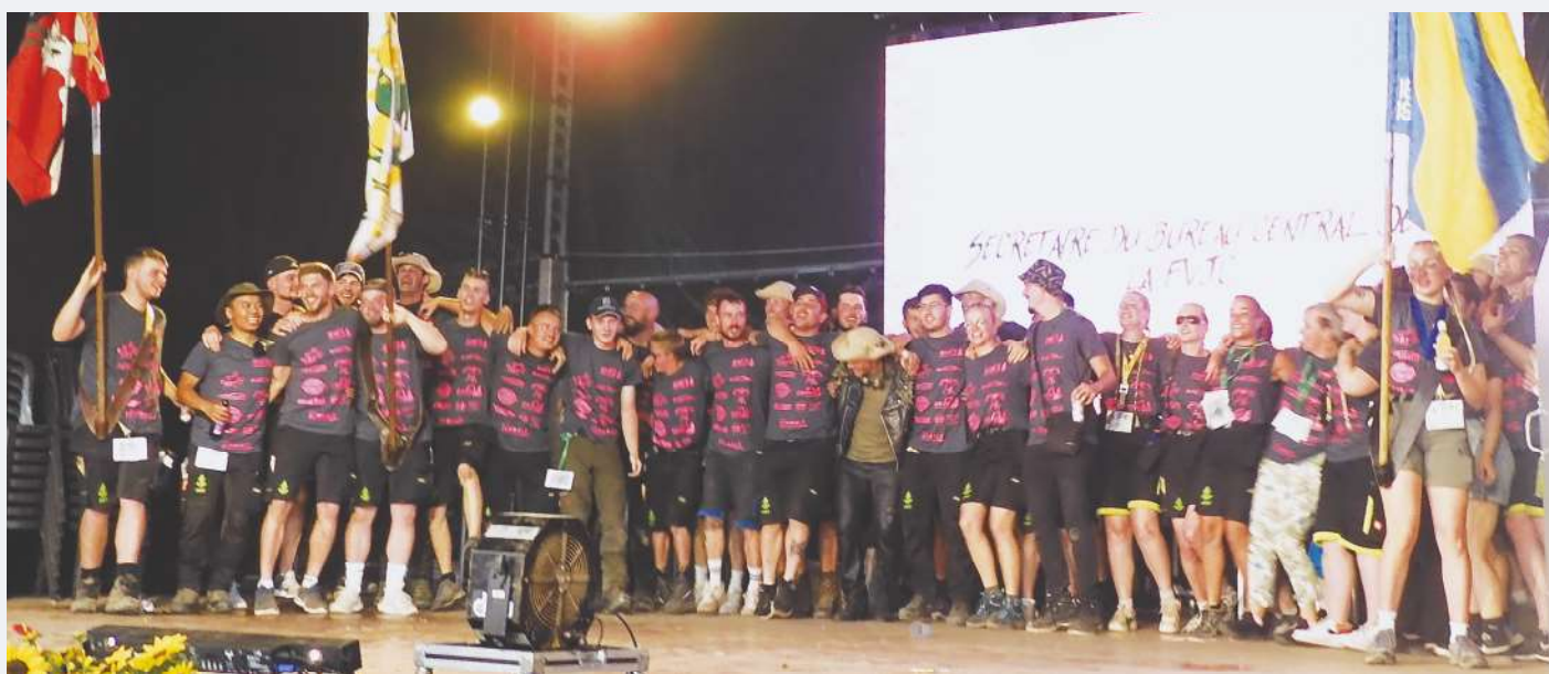
Giron du Centre Cutigny du 28 juin au 2 juillet.

La Municipalité et les collaborateurs de la Commune vous souhaitent de belles fêtes.