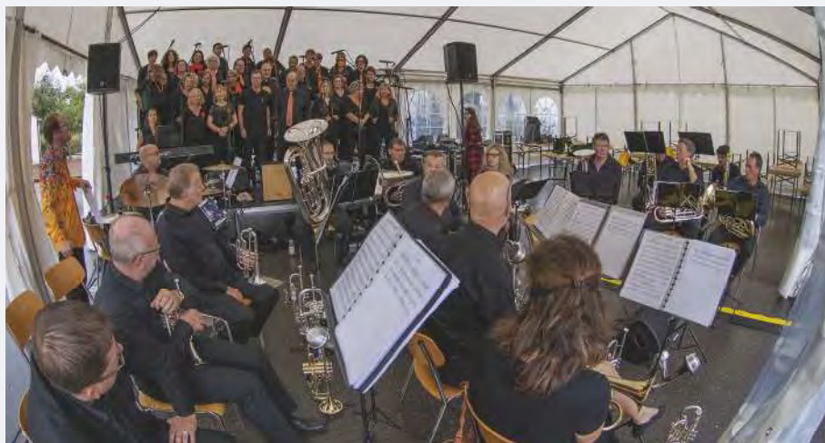
Concert de la formation Atout Chœur.