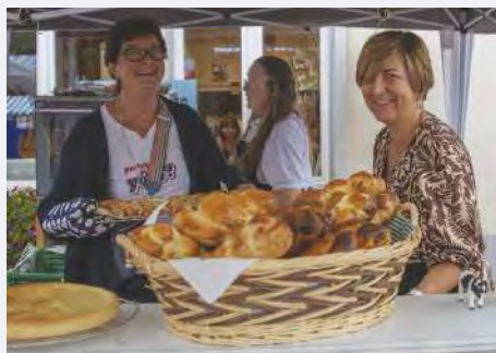
Le stand toujours appétissant des Paysannes vaudoises.