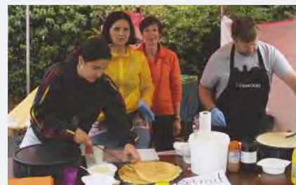
Le stand d'Atout Chœur.