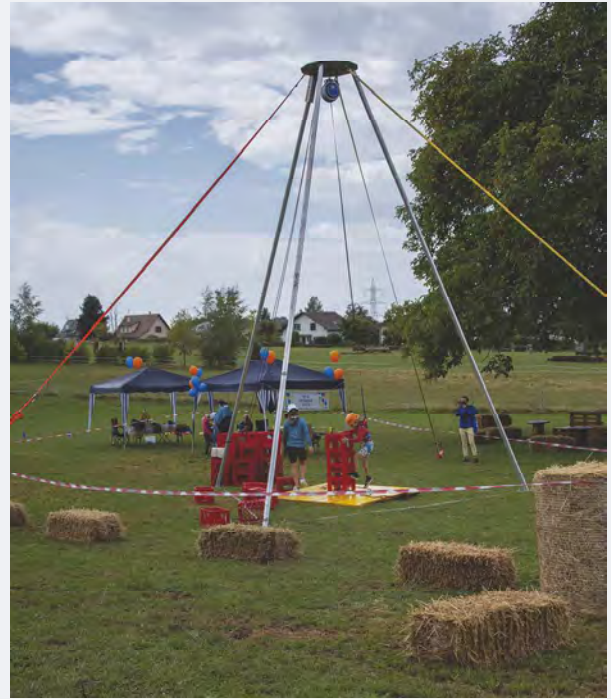
La Tour infernale proposée par la Gym Jeunesse.