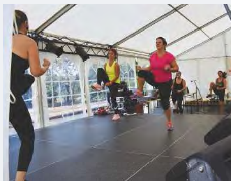
Démonstration de Jazzercise.