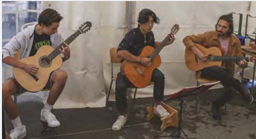
Les guitaristes du Petit Conservatoire du Haut Talent.