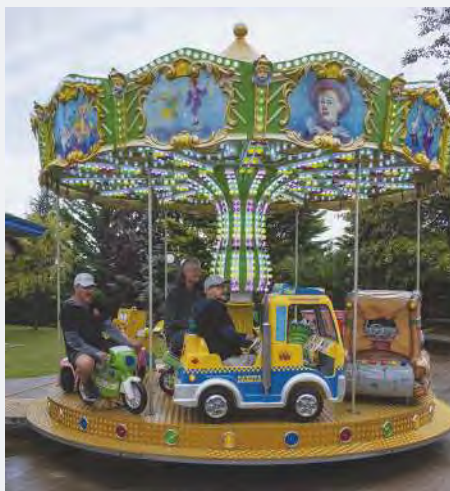
Très professionnels, les membres de l'USL vont jusqu'à tester eux-mêmes les installations !