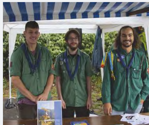
Les scouts de la Croisée.