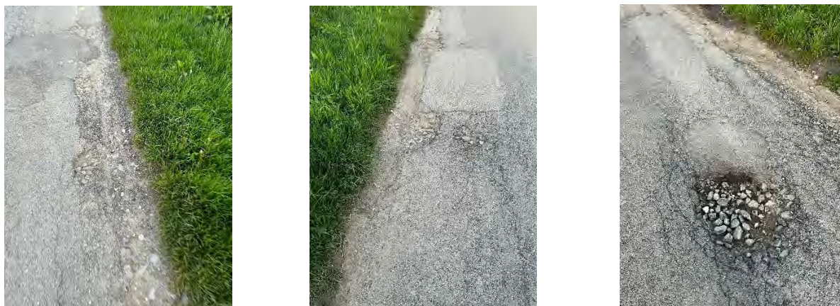
FIGURE 3 : PHOTOS DE LA CHAUSSÉE DÉGRADÉE

L'état fortement dégradé de la chaussée nécessite la réfection de celle-ci. Les nombreux et coûteux colmatages effectués par nos services de voirie n'ont plus d'effets sur les dégradations trop importantes des bords de chaussée et les nids de poules de plus en plus nombreux et profonds. Ces dégradations mettent en danger les usagers et notamment les cyclistes.