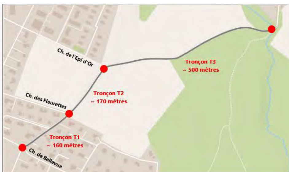
FIGURE 1 : DESCRIPTIF DES TRONÇONS

Pour rappel, le préavis n°21-2019 a été présenté au Conseil communal dans une période d'austérité qui engageait la Municipalité à ne proposer que les projets strictement nécessaires. Ainsi, et malgré l'état passablement dégradé de l'entier de la route en 2019, la Municipalité jugeait alors la réfection du tronçon T3 non prioritaire.