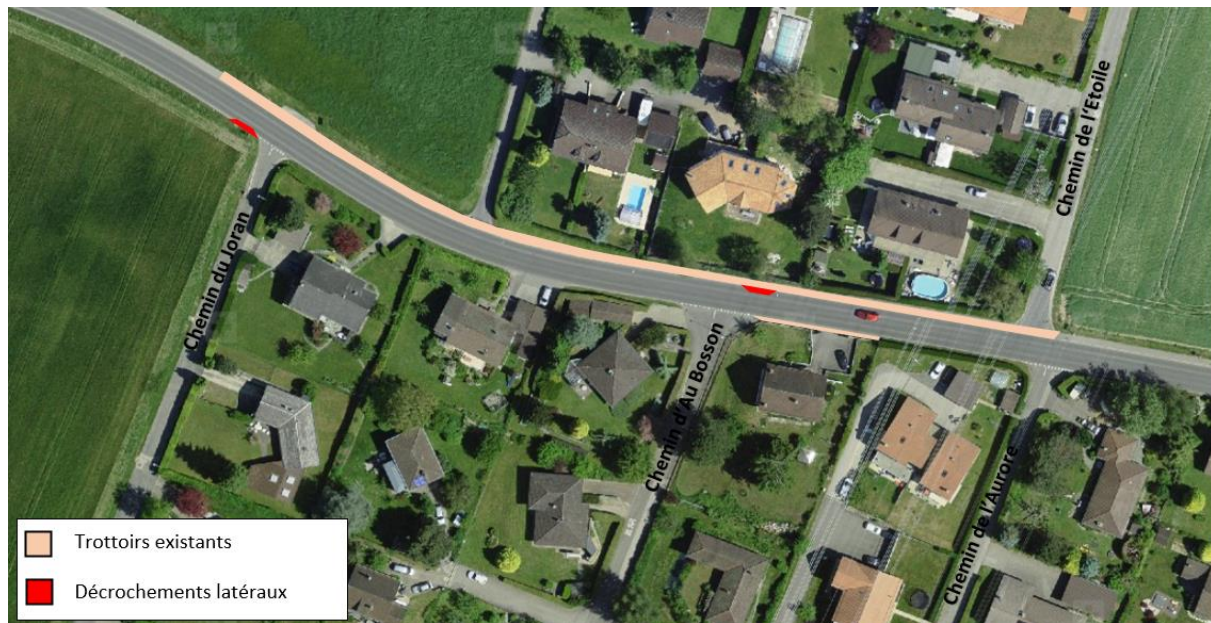
Figure 2 : Principe d'implantation des deux décrochements latéraux

Réduisant la largeur de la chaussée à 5.00 mètres, ces décrochements latéraux remplissent plusieurs fonctions. En rétrécissant ponctuellement la route, ils servent comme aide à la traversée pour les piétons provenant et/ou à destination du chemin du Joran et du chemin d'Au Bosson, sachant que la chaussée sud est dépourvue de trottoir. Ils constituent également des éléments de modération des vitesses de circulation, en cohérence avec l'étude d'assainissement du bruit. Le décrochement latéral le plus à l'ouest, situé à la limite communale avec Morrens, permet quant à lui de marquer la « porte d'entrée dans Cugy » et d'ainsi ralentir les véhicules entrants avant le débouché du chemin du Joran.